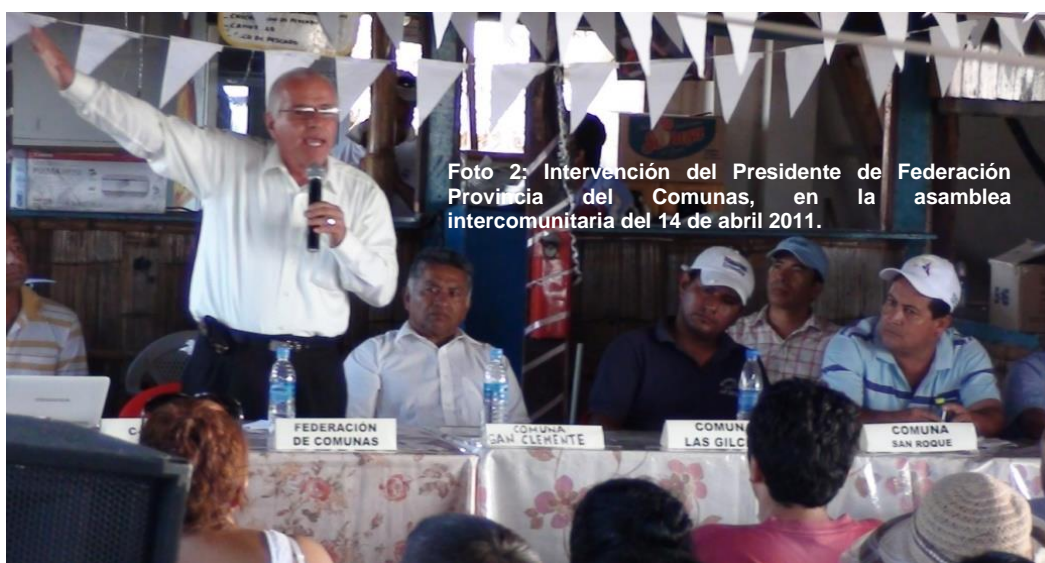
Foto 2: Intervención del Presidente de Federación Provincia del Comunas, en la asamblea intercomunitaria del 14 de abril 2011.

El 14 de abril del 2011 el comité intercomunitario, basados principalmente en el artículo 405 de la constitución en la República, en el que determina que el sistema nacional de áreas protegidas garantizará la conservación de la biodiversidad y el mantenimiento de las funciones ecológicas. AUTODECLARA, como Área Protegida Comunitaria, el ecosistema manglar del Estuario del Rio Portoviejo, su zona de transición y amortiguamiento, e inicia el trámite correspondiente ante el Ministerio del Ambiente.