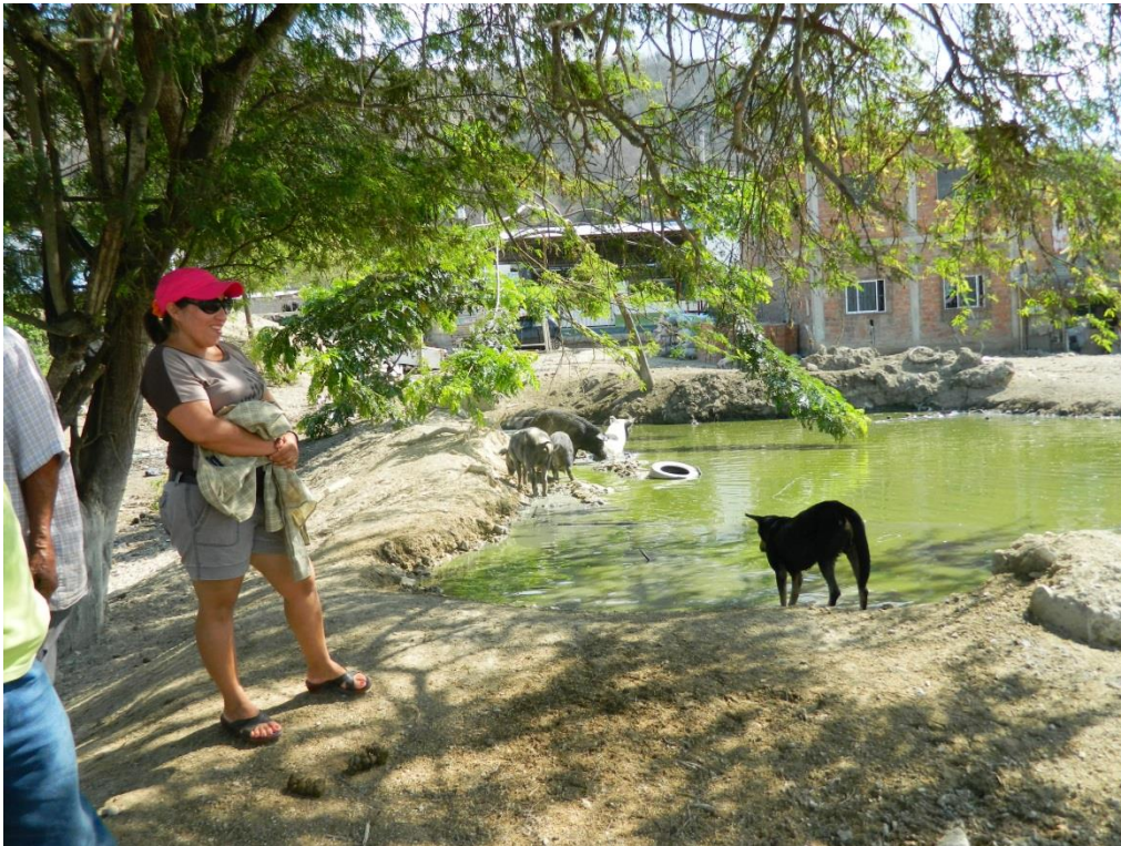
Foto 13: Inspección de agua negra provenientes de lavadora de Charapotó