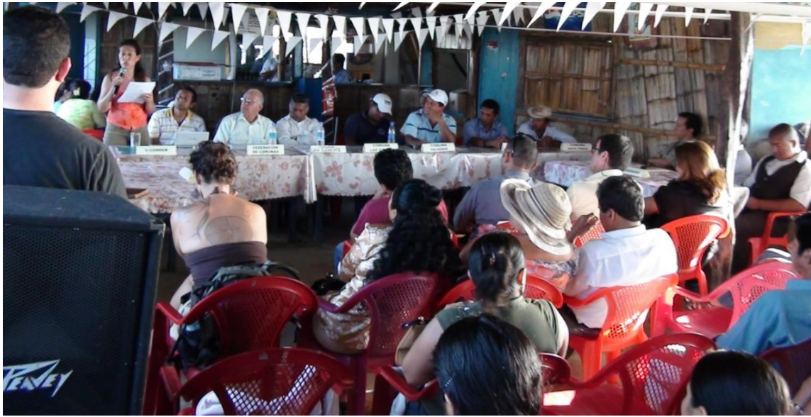
Foto 3: Intervención de la Presidenta de C-CONDEM, en la asamblea intercomunitaria del 14 de abril 2011.