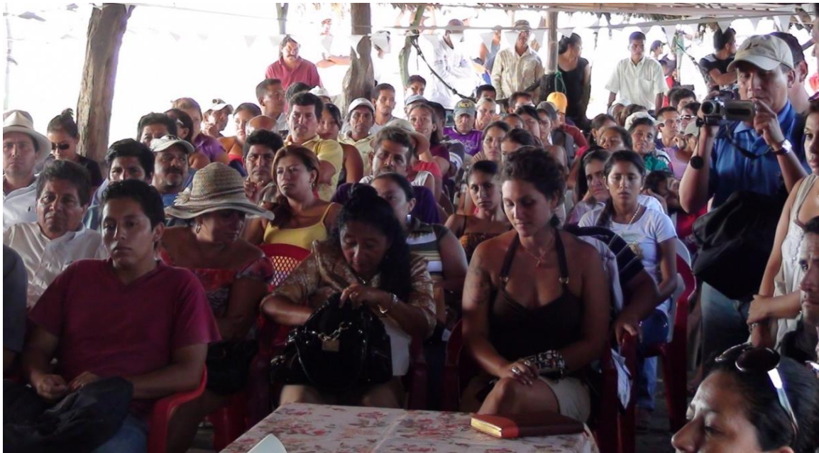
Foto 4: Autoridades, invitados/as y comuneros/as en la asamblea intercomunitaria del 14 de abril 2011.

El comité intercomunitario Estuario Río Portoviejo fue piloto en la autodeclaratoria de áreas protegidas comunitarias (APC), otras organizaciones y comunidades del estuario del río Chone y otras en la provincia del Oro, hacen lo mismo, lo que fortaleció las decisiones de los pueblos del manglar en velar y custodiar su territorios de forma organizadas y bajo administración propia.