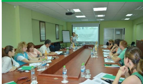
Sesiunea de instruire în scrierea de proiecte în baza priorităților de interes local cu finanțare din Programul de Granturi Mici al GEF, mun. Chișinău, 28 iunie 2016