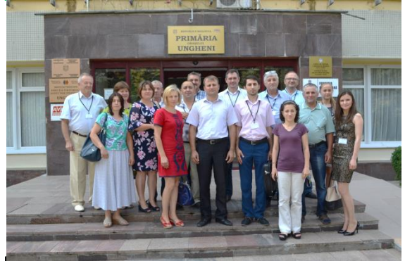
Atelier de lucru Sistemul Public de Date Spațiale de Mediu - instrument pentru implementarea Convenției Aarhus, or. Ungheni, 28.07.2016