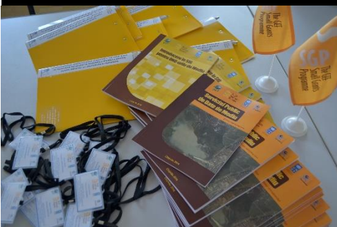
Ghidurile: “Introducere în SIG pentru ONG-urile de Mediu” și “Serviciul Public de Date de Mediu. Ghidul utilizatorului”

PENTRU MAI MULTE INFORMAȚII DESPRE PROIECT CONTACTAȚI