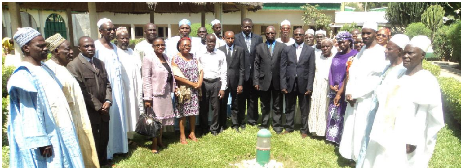
Photo d'ensemble des chefs de villages et autorités locales de Guider

Quelle est la situation des femmes, des jeunes et des groupes sociaux en situation de vulnérabilité en matière de connaissance de leurs droits et devoirs, et de leur implication aux instances de prise de décision dans les localités de Maroua et de Guider ? Quels sont les enjeux et défis à relever et les mécanismes sur lesquels il faut s'appuyer pour une participation accrue de ces populations ? Pourquoi est-il important, voire indispensable, d'assurer la prise en compte des préoccupations de toutes et tous sur le plan local et national ?