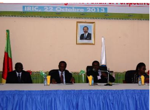
Journée portes ouvertes le 22 octobre 2013 à l'Institut des Relations Internationales du Cameroun (IRIC)