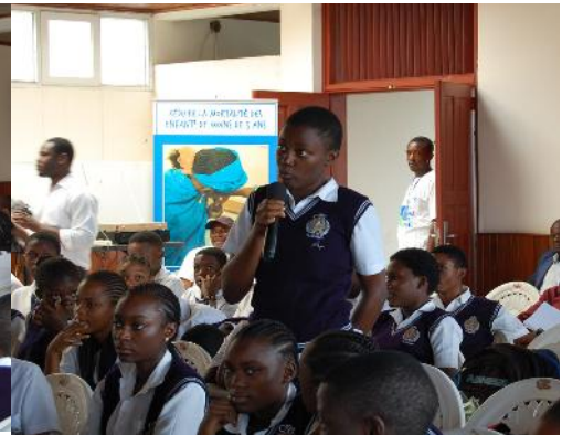
Causeries éducatives le 21 octobre 2013 au Lycée Général Leclerc et au Collège la Gaieté