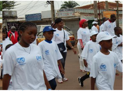
Activités sportives les 19 et 20 octobre 2013 au complexe sportif BEAC (match de football mixte) et à l'avenue du 20 mai (marche sportive)