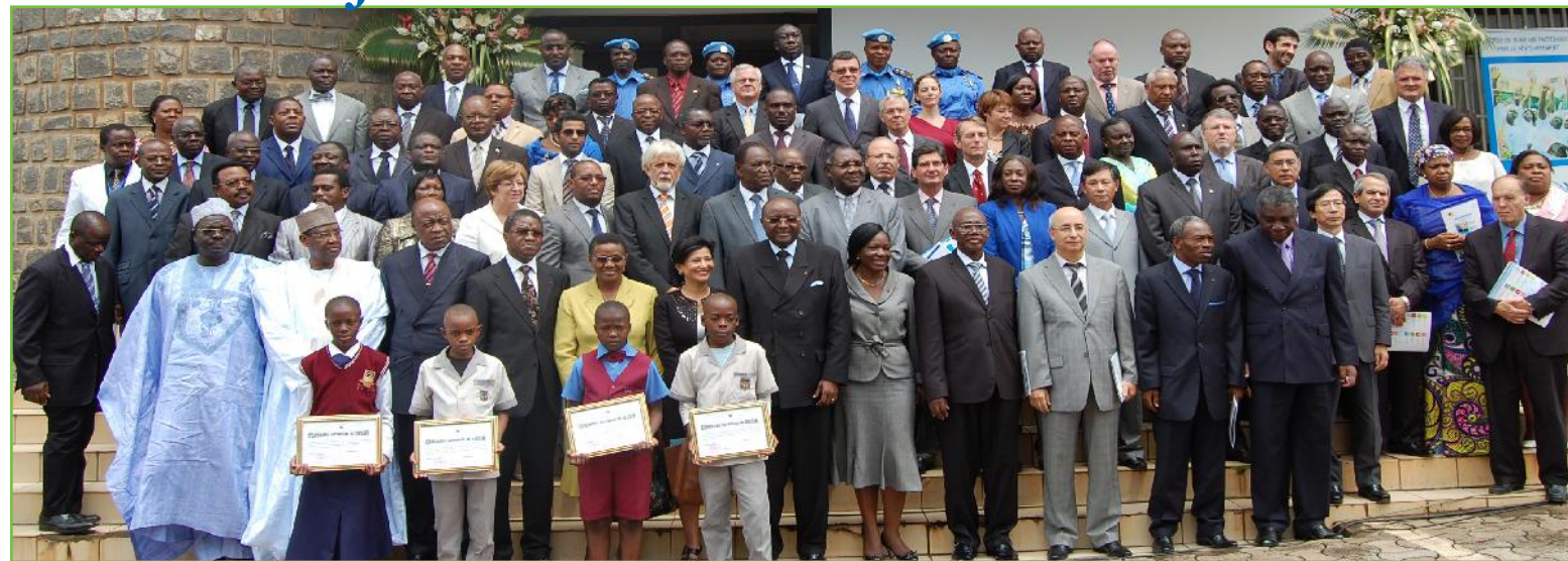
Membres du Gouvernement et Communauté diplomatique

Le Gouvernement du Cameroun et le Système des Nations Unies ont célébré le 24 octobre 2013 la 68 ème journée des Nations Unies.