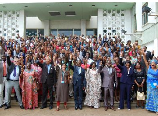
TOWNHALL MEETING le 23 octobre 2013 (Réunion générale du personnel de tout le système des Nations Unies au Cameroun)