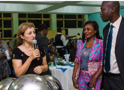
Soirée de Gala le 24 octobre 2013 au Palais des Congrès sous le thème de la "diversité culturelle"